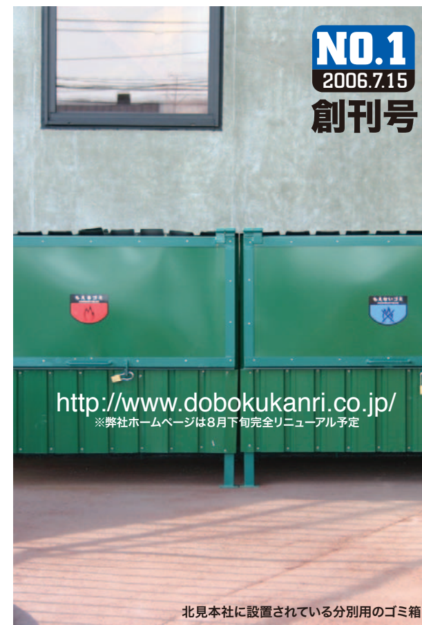
北見本社に設置されている分別用のゴミ箱