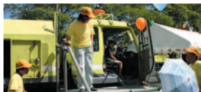
展示されている作業車に体験試乗することも。(2006年)