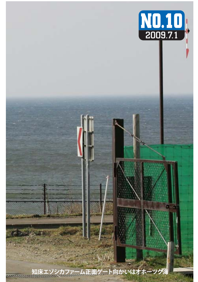
知床エゾシカファーム正面ゲート向かいはおホーツク海