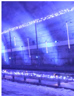
ライトアップされたトンネル

詳しくは、知床ファンタジア実行委員会(知床斜里町観光協会内) TEL.0152-22-2125 FAX.0152-23-6226まで。 主催/知床斜里町観光協会