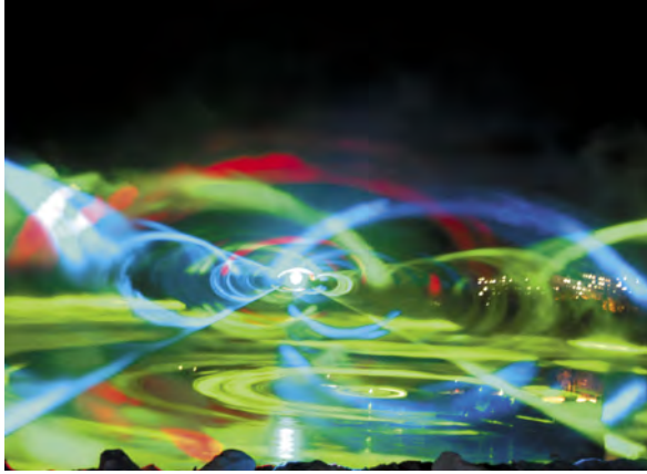
スモークをスクリーンにしてレーザー光線を照射

今年で第24回目を迎える知床ファンタジア2010は毎晩午後8時より20分間、見学に訪れた人達を幻想的な世界へと導きます。厳寒の張りつめた空気の中、空中に映し出されるオーロラは見る者すべてを魅了し、寒さを忘れ感嘆の声が上がります。