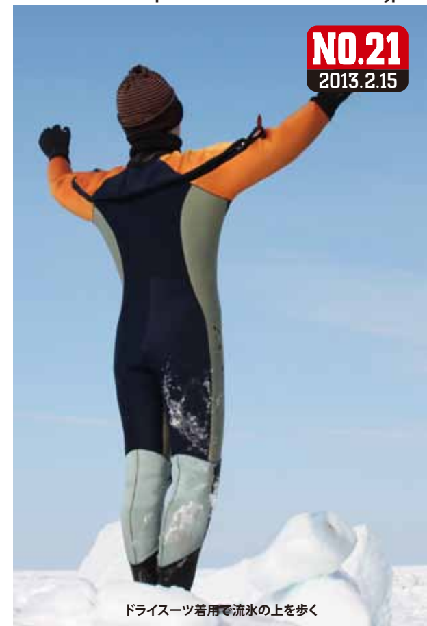
ドライスーツ着用で流氷の上を歩く