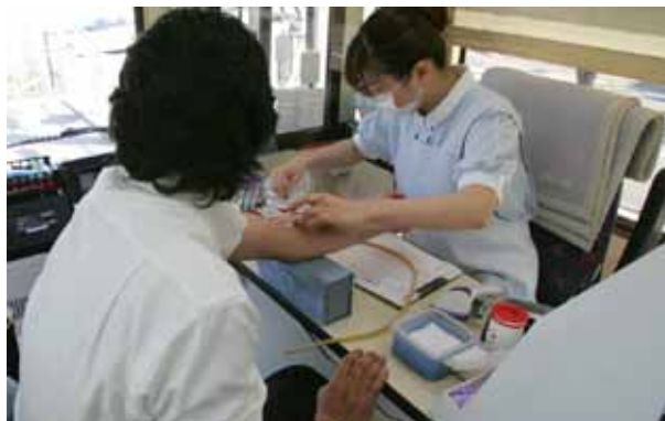
周辺企業にも協力を呼びかけ、年2回の献血活動を継続

当社は、社会奉仕活動の一環として旭川赤十字のご協力により当社敷地内にて献血活動を行っております。