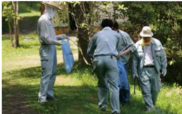
4つのグループに分かれ、公園内のゴミ拾いを行いました。

当社は、2010年から毎年6月の第1土曜日に、北見市内の野付牛公園敷地内においてゴミ拾いなどの清掃活動を行っており、今年も晴天の中行われました。