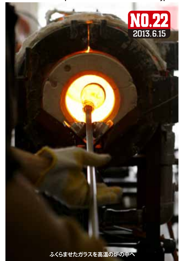
ふくらませたガラスを高温の炉の中へ