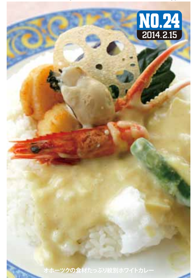
オホーツクの食材たっぷり紋別ホワイトカレー