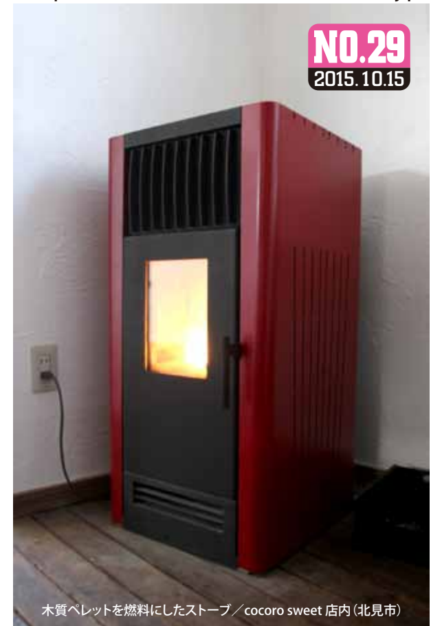
木質ペレットを燃料にしたストーブ / cocoro sweet 店内(北見市)