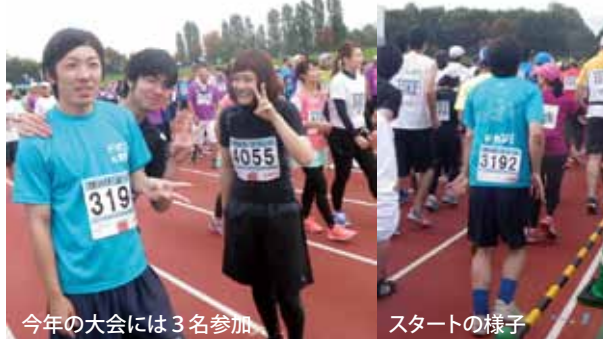
今年の大会には3名参加