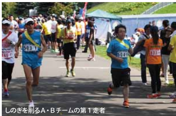
しのぎを削るA・Bチームの第1走者

第30回 端野カレーライスマラソン 2015年9月20日 4つのコース上に配置された「ジャガイモ」「肉」など、カレーの具材を持ち帰り、ゴール後、カレーライスを作って食べるというユニークなマラソンで今年30回目。参加するのは今回がはじめてで、本社からは男女混合2チーム、計8名がそれぞれのコースにチャレンジしました。