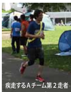
疾走するAチーム第2走者

今回で連続11回参加の豊平川サーモン駅伝。賞品はすべて鮭というこの大会。残念ながら今年も一本も手に入らず。札幌支店、本社から脚に自信のある10名が集まり、A・B2チームに分かれ競い合いました。アクシデントもありましたが怪我も無く、無事終了しました。