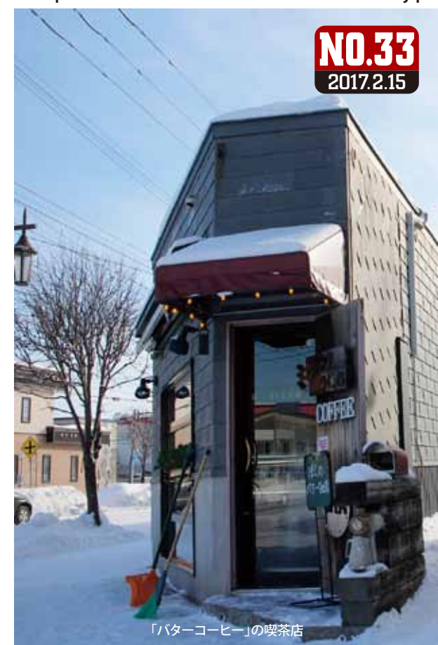
「バターコーヒー」の喫茶店