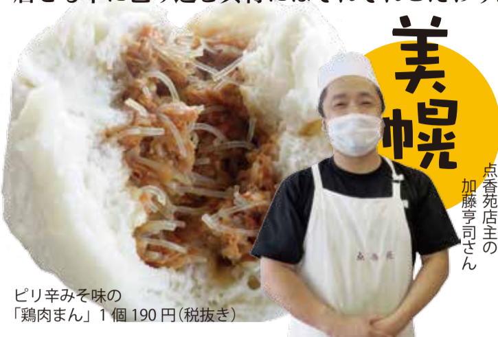
ピリ辛みそ味の 「鶏肉まん」1個 190円(税抜き)