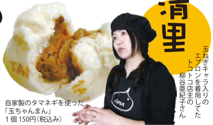
自家製のタマネギを使った 「玉ちゃんまん」 1個 150円(税込み)