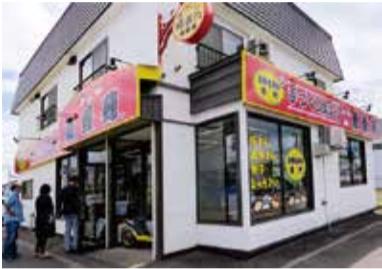
開店時から行列の点香苑