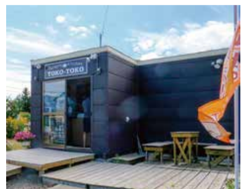
自宅敷地に TOKO-TOKO 店舗