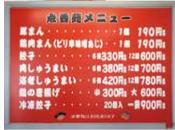
店内壁面のメニュー