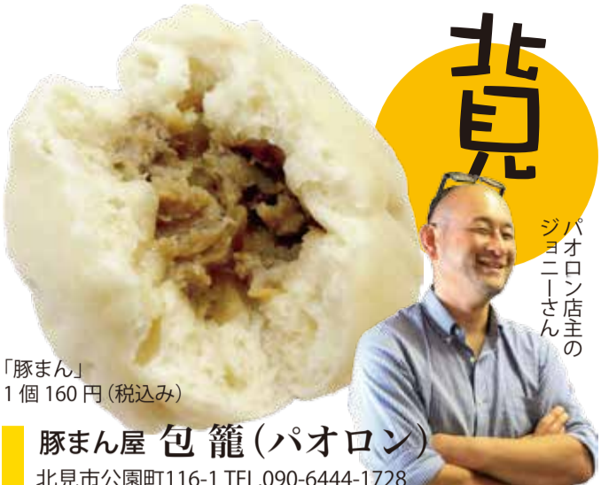
「豚まん」 1個 160円(税込み)

今回は、ドカン編集部おすすめの「オホーツク三大肉まん」のご紹介です。ご協力いただいた各店とも中に包み込む具材にはそれぞれこだわりがあります。ぜひ、食べ比べてみてください。