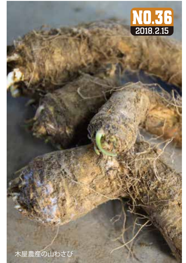
木屋農産の山わさび