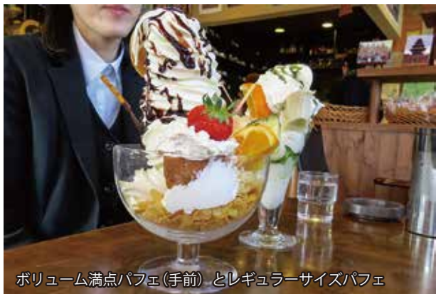
ボリューム満点パフェ(手前) とレギュラーサイズパフェ

wikipediaによるとデカ盛り(デカもり)とは、通常量より極端に多い料理を一つの食器などに盛ることとあります。激盛り、爆盛りとも言い、いわゆる「大盛り」を大きく超える量を盛った料理を指します。