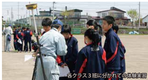
各クラス3班に分かれての体験実習