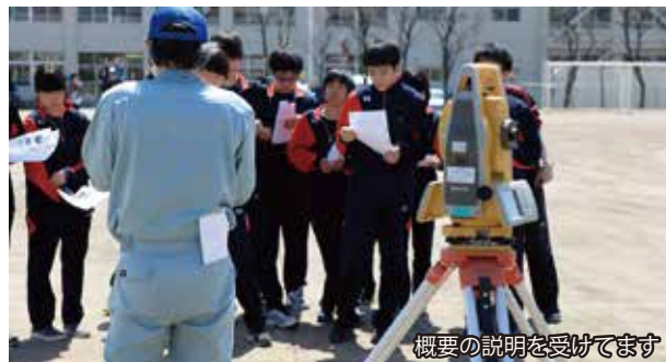
概要の説明を受けてます

地域貢献の一環として平成28年から始めた、中学生対象の測量実習体験授業は去る5月15日に実施され、今年で3回目となりました。運動会を控えたグラウンドのコース整備としてTSやGNSSなどを使ったコースの位置出しを北見市立小泉中学校2年生の皆さんに体験していただきました。