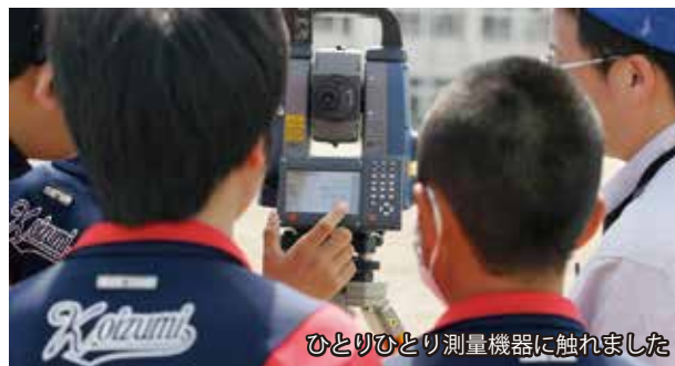
ひとりひとり測量機器に触れました

建設コンサルタント業・測量業・補償コンサルタント業 ISO 9001：2008認証登録