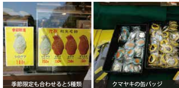
季節限定も合わせると5種類 クマヤキの缶バッジ 道の駅の売店には、クマヤキのTシャツやバッジなどのグッズも!

建設コンサルタント業・測量業・補償コンサルタント業 ISO 9001:2015 認証登録