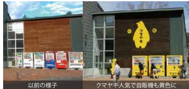
以前の様子 クマヤキ人気で自販機も黄色に 道の駅「あいおい」では自販機までもクマヤキカラーに!

2016年1月に東京・東武百貨店で開催された「大北海道展」に出店し、姿が可愛いとSNSなどで広がり会場に連日長蛇の列ができるほどの盛況だったそうです。その後、テレビ番組で取り上げられたこともあり爆発的な人気となりました。今年5月の大型連休は売り場に長蛇の列ができ、この日一日で2千個以上売れたそうです。