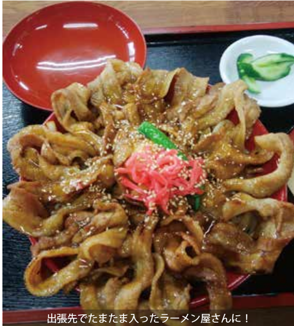
出張先でたまたま入ったラーメン屋さん!

wikipediaによるとデカ盛り(デカもり)とは、通常量より極端に多い料理を一つの食器などに盛ることとあります。激盛り、爆盛りとも言い、いわゆる「大盛り」を大きく超える量を盛った料理を指します。