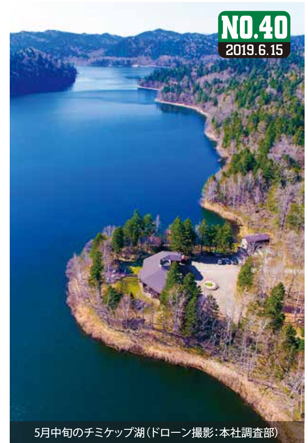
5月中旬のチミケップ湖