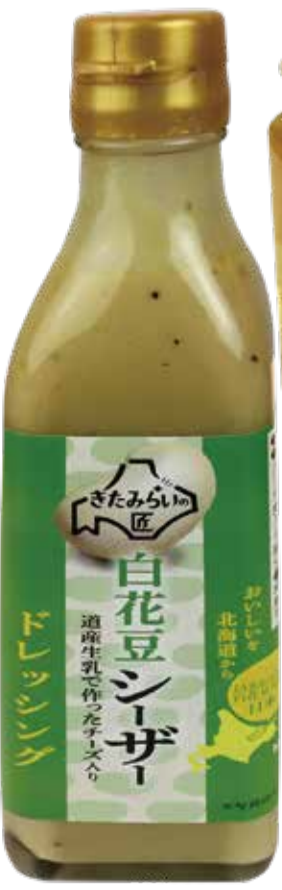
白花豆のドレッシング 購入先：パラボ(北見)