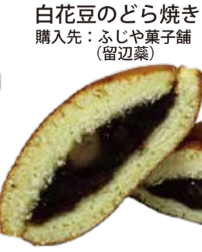
白花豆のどら焼き 購入先：ふじや菓子舗(留辺蘂)