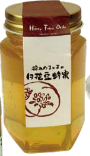
白花豆蜂蜜 購入先：塩別つるつる温泉(留辺蘂)