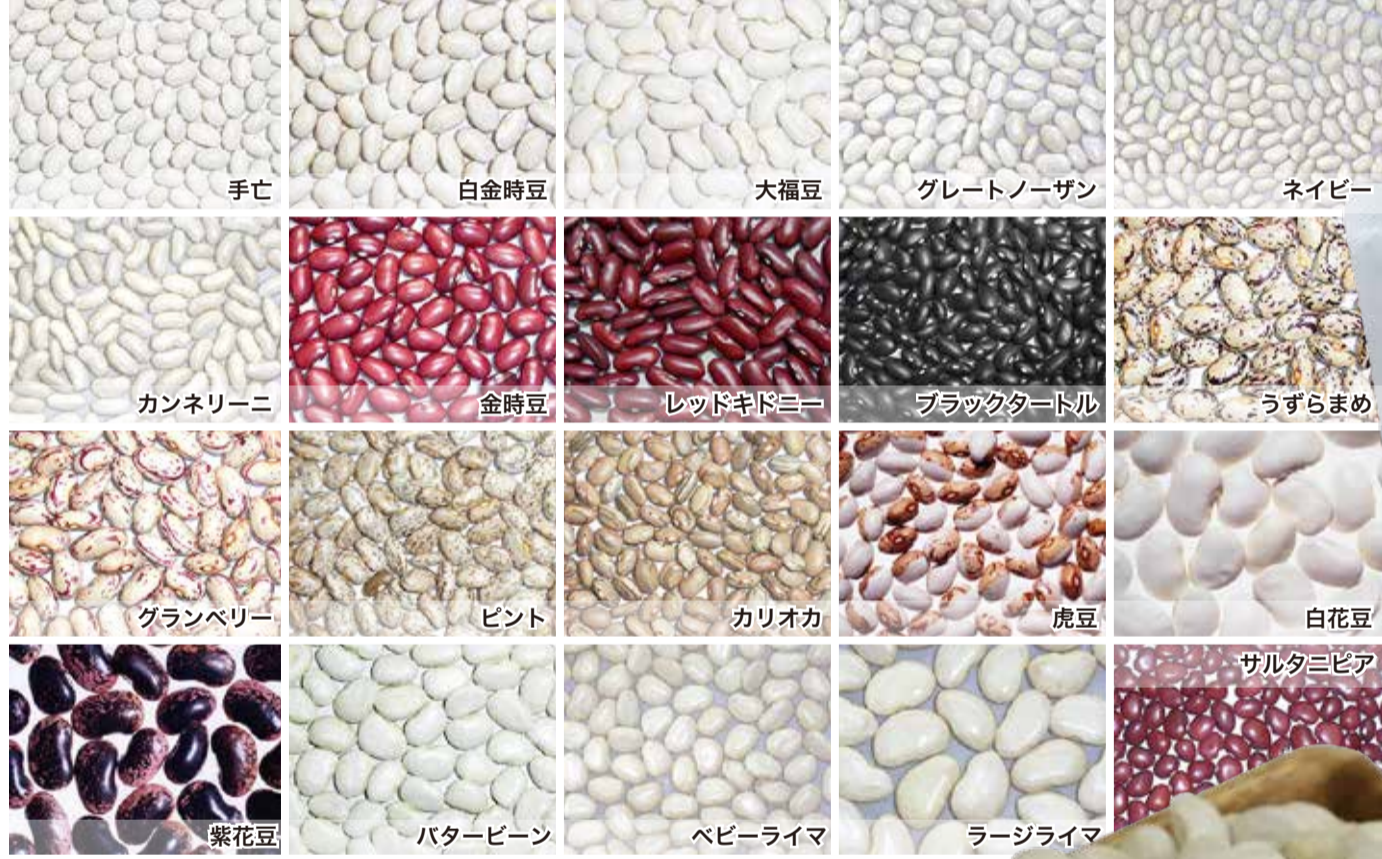
いんげん豆の種類