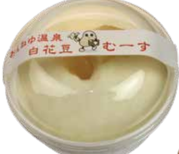
白花豆のムース 購入先：ふじや菓子舗(留辺蘂)