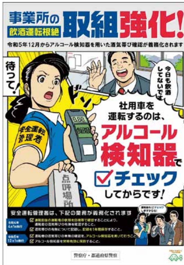
警察庁「飲酒運転取り組み強化」のパンフレット

「アルコール検知器を用いた運転者の酒気帯びの有無の確認、及び記録の保存」については、当社は令和4年4月1日より取り組んでおりましたが、いよいよ令和5年12月1日より義務化されました。先行して行っていたこともあり施行日から、ミス・トラブルもなく実施されています。