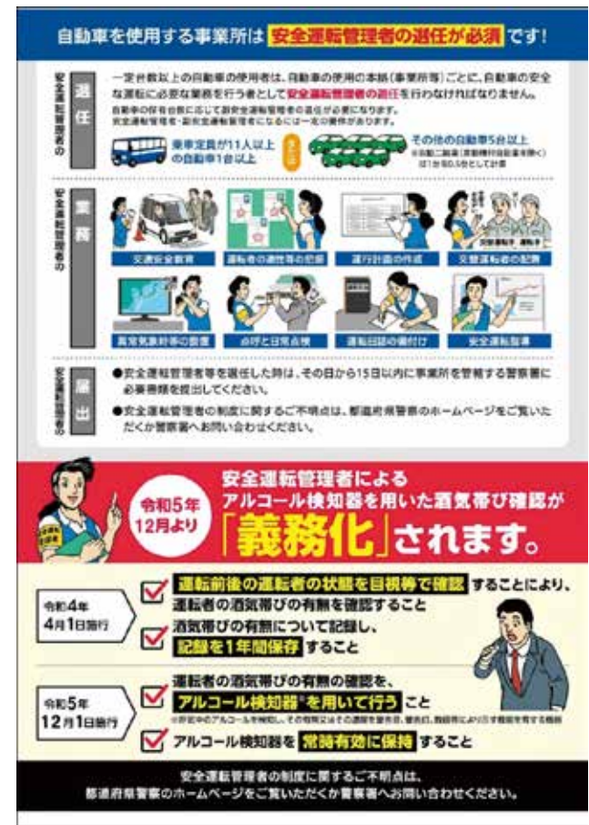
警察庁「飲酒運転取り組み強化」のパンフレット

測定器を使う職員それぞれに使い捨てストローと接続している部分を押さえて呼気を吹き込み測定、会社に戻った際にPCに記録する。