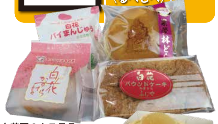
白花豆のカステラ・まんじゅう他 購入先：ふじや菓子舗(留辺蘂)