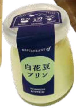
白花豆のプリン 購入先：レストランエフ(留辺蘂)