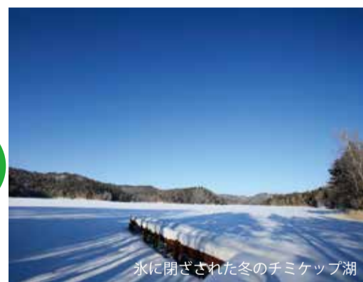
氷に閉ざされた冬のチミケツ湖

厳冬の1月中旬から2月下旬、チミケツ湖はワカサギの氷上釣りポイントとして真冬でも楽しめます。周辺に、観光地として有名な阿寒湖、屈斜路湖があること、チミケツ湖にアクセスする際、幹線道路が近くにならないことで交通の便が悪いため、隠れた穴場となっています。水質的には、栄養価がいいとは言えませんが、環境に適合するワカサギが生息できる湖となっています。