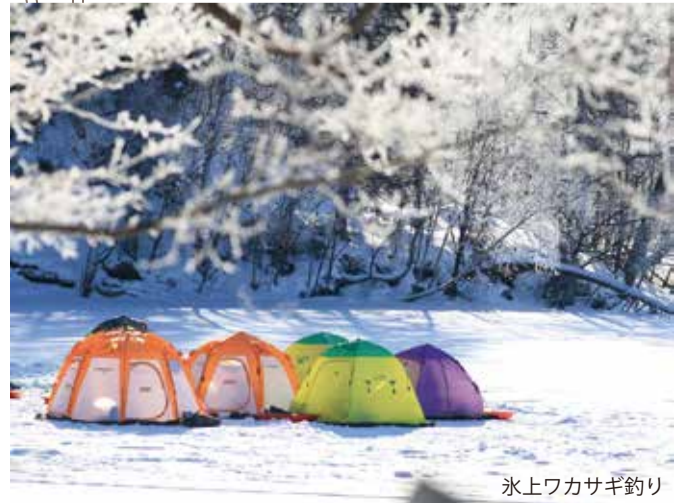
氷上ワカサギ釣り