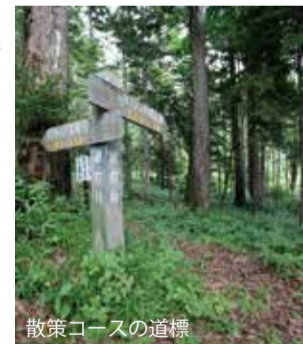
散策コースの道標

台風の影響で倒木などにより閉鎖されていた4つの散策コースの整備が終わり、今シーズンからすべて通行可能になりました。湖畔のキャンプ場は静かな環境で最小限の設備ながら、なかなか人があります。