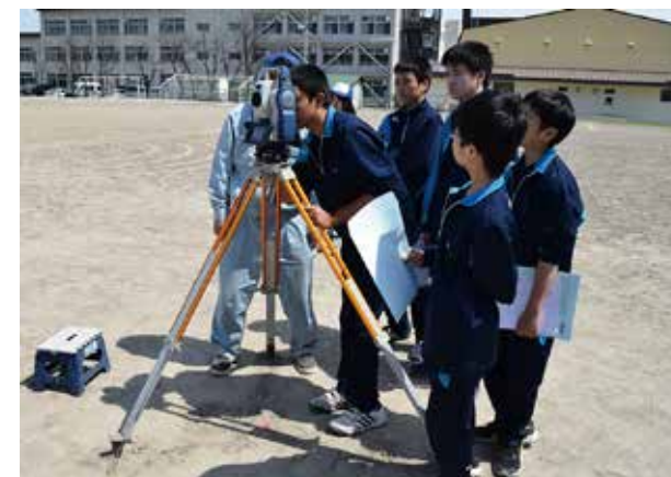
グループに分かれ順番に体験してもらいました