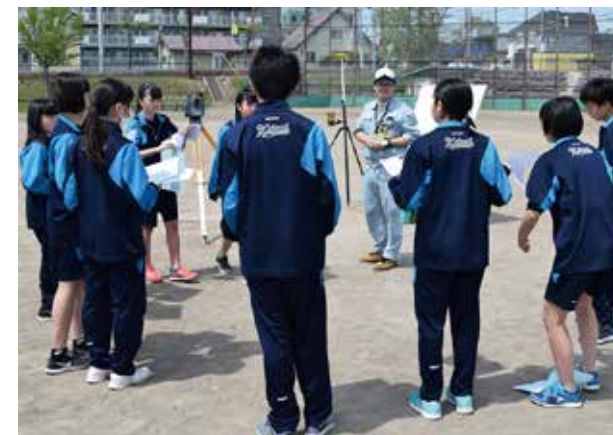
2年生の技術科の時間を使い実習しました

このような機会を与えてくださった校長先生はじめ、教職員のみなさまに感謝申し上げます。