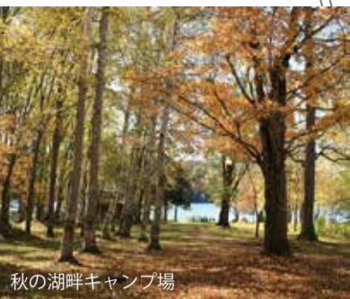
秋の湖畔キャンプ場