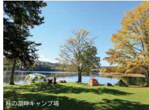
秋の湖畔キャンプ場

深い森に取り囲まれたチミケツの秋は、より一層静かな雰囲気が漂い、秘境ムード満点なものがあります。ここには、手付かずの自然がたくさん残っています。湖の外周はおよそ10km。秋の紅葉シーズンには、赤や黄に染まった湖畔の木々が、静かに佇む湖面に映り込み美しい景観を作り出してくれます。幹線道路から離れた奥地にあるため、周囲には人工的な建物はほとんどありません。落ちて紅葉を楽しみたい人には、オススメの場所です。