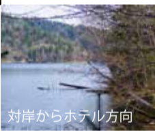
対岸からホテル方向

長期間閉鎖されていた西湖畔コースの整備が終わり、2019年5月から再び散策することができるようになりました。