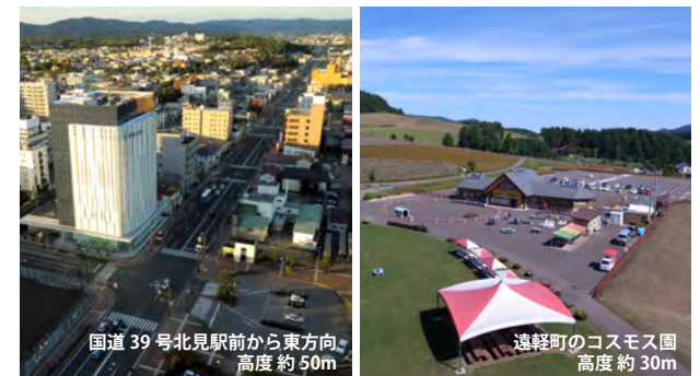
国道 39 号北見駅前から東方向 高度約 50m

システム開発元 MEGIS 長菱設計株式会社 スカイキャッチャー北海道代理店 茨井建設株式会社