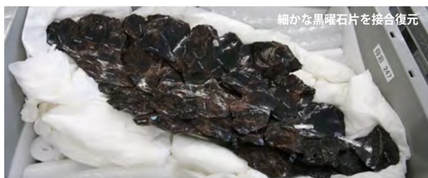
細かな黒曜石片を接合復元

今後遠軽町は、採取した黒曜石等の展示室を白滝総合支所に開設する予定です。展示室は2011年の春にオープンする予定なので一度足を運んでみてはいかがでしょうか。