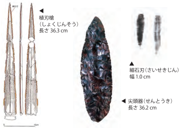
植刃槍 (しよくじんそう) 長さ 36.3 cm

世界的規模とも言われる黒曜石原産地であり、露頭 (ろとう) が多数点在しています。旧石器時代 (今から2万5千年~1万年前) から縄文時代にかけての黒曜石 (白滝産) の流通範囲は、北はシベリア (マラヤ・ガーバナニ遺跡) やサハリン (ソコル遺跡・アガンキ5遺跡)、北海道内、南は青森県 (三内丸山遺跡)・新潟県などの東北北部にまで及んでいます。