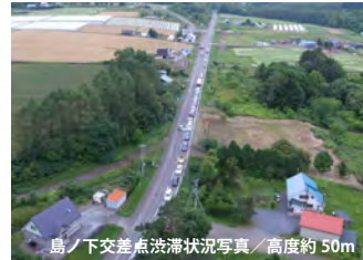
島 / 下交差点渋滞状況写真 / 高度約 50m

地上モニターで撮影ユニットからの映像を確認できます。カメラのアンゲルは、無線遠隔操作によって上下左右に操作可能であり、映像を見ながらカメラアンゲルを急に検討できるため、撮影したいイメージをそのまま実現できます。