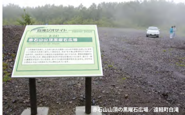
赤石山山頂の黒曜石広場 遠軽町白滝

遠軽町には白滝地域を中心に旧石器時代の遺跡が多数あります。石器の材料となる黒曜石の原産地であることから、石器製作を行った大規模な遺跡が形成された白滝遺跡群は、貴重な遺跡として「国指定史跡」の指定を受けています。石器加工技術の特色として「湧別技法」と呼ばれる細石刃 (さいせきじん) を作り出す加工法があります。