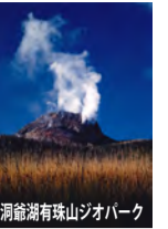
洞爺湖有珠山ジオパーク

洞爺湖は、100万年前の爆発的な噴火でできたカルデラ湖です。火山噴火の被害を受けた道路や建物、美しい湖と山の景観など、自然の恵みと災いについて考えることのできるジオパークです。