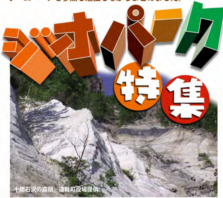
十勝石沢の露頭

世界ジオパークを目指す遠軽町・白滝ジオパークを応援し、ジオパークの紹介を企画しました。内容の多くは各機関のホームページを参照し勉強しながらまとめました。