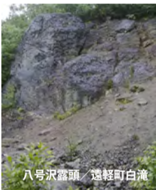
八号沢露頭 遠軽町白滝

日本には現在14地域の「日本ジオパーク」があり、その内4地域 (洞爺湖有珠山・糸魚川・島原半島・山陰海岸) が「世界ジオパーク」に認定されています。山陰海岸については、今月3日にギリシャで開かれた会議で認定されたばかりです。他の日本ジオパークは、アポイ岳 (北海道)、南アルプス (長野県)、室戸 (高知県)、恐竜渓谷ふくい勝山 (福井県)、隠岐 (おき) (島根県)、天草御所浦 (熊本県)、阿蘇 (熊本県) および今年9月に認定された白滝 (北海道)、伊豆大島 (東京都)、霧島 (鹿児島県) が認定されています。「世界ジオパーク」は今月3日の最終審査により25ヶ国で77ヶ所 (新聞報道) となりました。