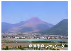
島原半島ジオパーク