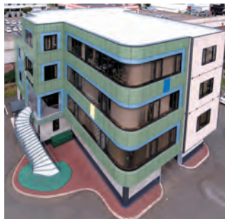
本社全景/スカイキャッチャーによる空撮

なお、地域情報誌の特集記事(地域情報)に関しての掲載希望のテーマや疑問、質問等がありましたら、企画運営委員会デザイン室desgin@dobokukanri.co.jpまでご連絡ください。全ての希望には添えませんが、ぜひ参考にさせていただきます。