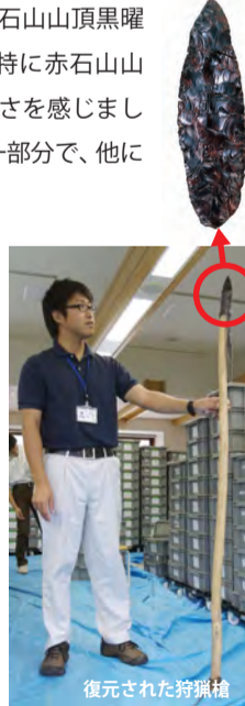
復元された持柄槍

右の写真は、旧石器時代にこのような道具で狩りをしていただいたのではないかと復元したものです。先端部が黒曜石 (尖頭器 (せんとうき)) です。下の写真は現地で採取した個々の黒曜石片を石の模様を見て復元 (接合) したものです。まさに職人芸で、感動しました。