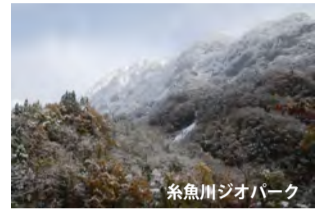
糸魚川ジオパーク

日本を東西に分ける大断層糸魚川 (いといがわ) 静岡構造線と、その東に広がるフォッサマグナと呼ばれる地溝帯 (ちこうたい) が糸魚川を通っています。5億年前から現在までの様々な岩石・化石・地層を観察することができます。