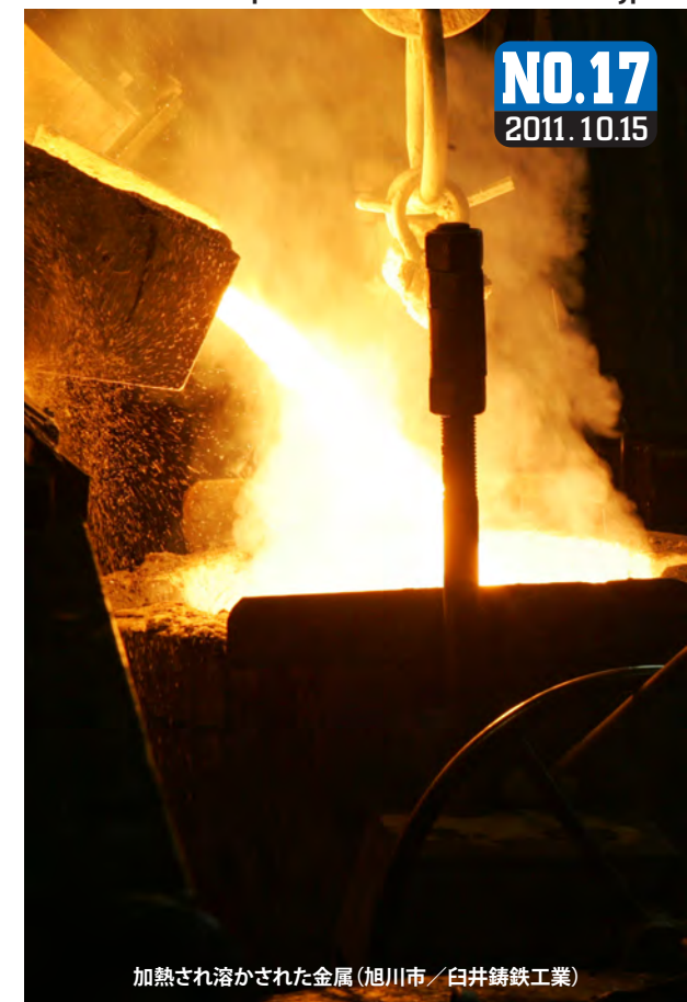
加熱され溶かされた金属(旭川市/白井鑄鉄工業)