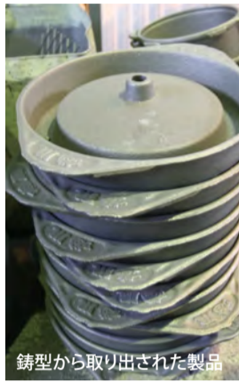
鋳型から取り出された製品

このようにシンプルな製造方法だからこそ、複雑な形状の物でも造りやすく、原理的にはどのような形のものでも造ることが可能です。ただ、遙か昔から世代を超え国境をも越えて受け継がれてきた技術は、シンプル故に奥深く、洗練された作業工程は気の抜けない難しい作業となります。