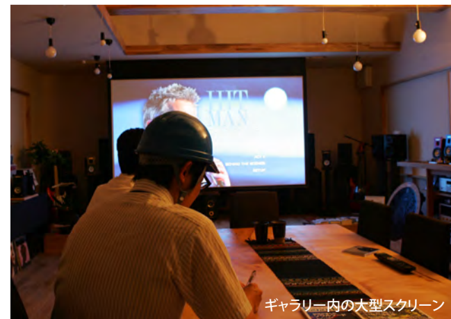
ギャラリー内の大型スクリーン