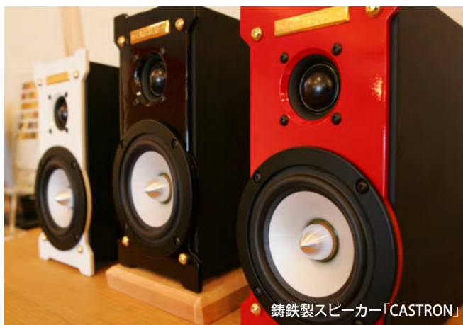
鋳鉄製スピーカー「CASTORN」