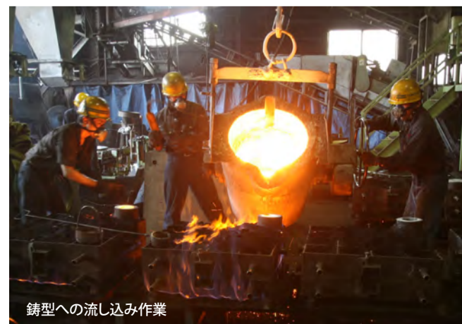
鋳型への流し込み作業

その他にもジンギスカン鍋「蒼き狼」、すき焼き鍋「醇 JUN」、しゃぶしゃぶ鍋「爛 RAN」などの鋳鉄鍋、だるまストーブ「禅 ZEN」、デザインマンホールの蓋なども展示されています。デザインマンホールは道内の多くの市町村で採用されていますので、北海道の爽やかな秋晴れの中、のんびりとご当地のデザインマンホールを探しながら歩いてみるのも面白いかもしれません。