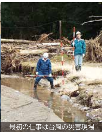
最初の仕事は台風の災害現場