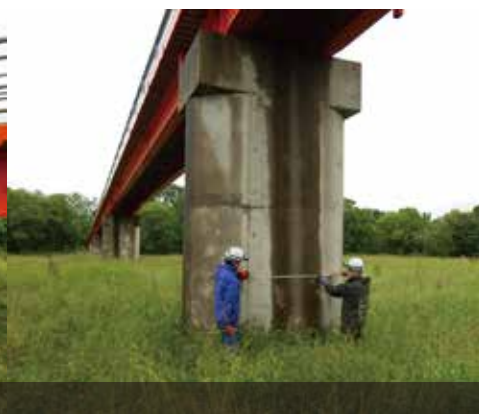
河川横断工の設計に伴う現況調査