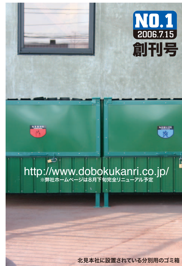
北見本社に設置されている分別用のゴミ箱