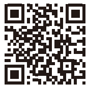
千歳のパン屋さん 「ちいさなめ」

千歳の住宅街にあるパン屋さんです。お店の建物もパンもとても雰囲気があります。お値段はお手頃です。買ったのはメロンパン、白パン、穀物パン、クリームパンです。中でもクリームパンが美味しかった! 濃厚なクリームで、味もしっかりしています。卵の味が濃く自分好みの美味しさでした。白パン、穀物パンは自宅に持って帰り翌朝食べました。もちもちしていて優しい味でした。一緒に行った同僚も別の種類のパンを買いましたが、どのパンを食べても美味しかったとのことでした。(札幌支店:高山)