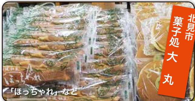
「ほっちゃんれ」など