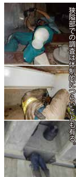
狭い空間での調査は体制的に入りにくい箇所も有る。

近年の橋梁は、維持管理に配慮され、点検スペース等が確保されているため、調査もし易いのですが、補修が必要な橋は、比較的古い橋梁が多いため、支承周辺も狭い事が多いです。こうした狭い空間に入っただけの調査では、先に述べた雨天調査と相まると全身泥まみれになりながら、また、狭くて体制がづらい時は奇声を漏らしながら泥臭く調査を実施しています。