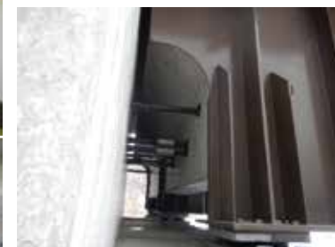
H24以降の設計は、今後の維持管理に配慮された設計となっている。

ああ明日、いや正直明後日あたりに体が痛くなるなあとと思う事がたまにありながらも、劣化要因を解明したいという好奇心と情熱によって、毎回張り切って調査に取り組んでいます。