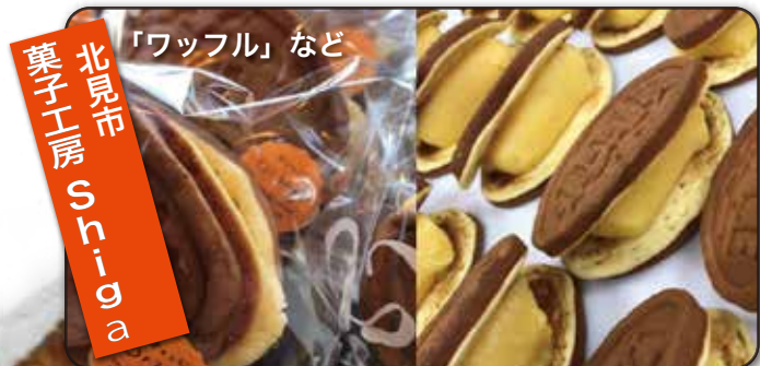
「ワッフル」など 菓子工房 Shiga