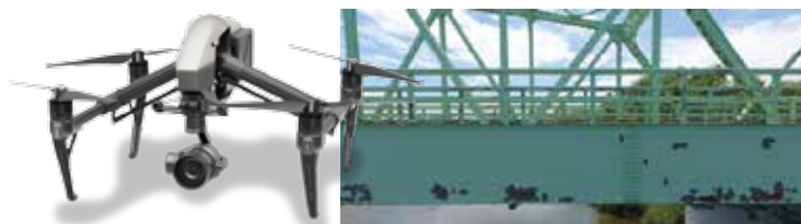
桁側面の損傷状況をUAVにより状況確認。