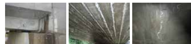
伸縮装置の端部のみ漏水している場合は、取替えではなく部分補修とすることも有る。 床版下面に遊離石灰が有るものの雨天時確認の結果、漏水がない。→橋面防水が劣化しており更新が必要 床版下面に遊離石灰が有るものの雨天時確認の結果、漏水がない。→橋面防水が健全なため、防水対策不要

橋梁調査において、時に雨はまさに恵みの雨となります。橋梁損傷の要因は、多くの場合水が関連します。雨天時に現地確認をする事で非常に多くの情報が得られ、対策検討に大きく役立つ事もあります。したがって、最近では積極的に雨天時に現場へ行くことを心掛けています。むしろ現場に行く事の多い夏期シーズンは、雨が降る日を待ちわびている事もあったりします。（程良い雨に限りませんが）