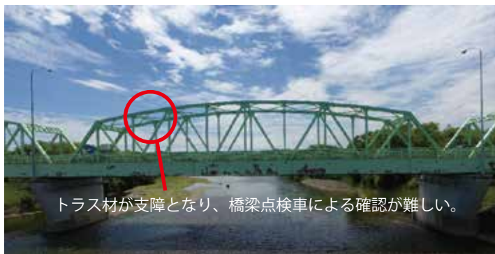
トラス材が支障となり、橋梁点検車による確認が難しい。

橋梁近接目視方法として、最もポピュラーなのが橋梁点検車を用いた目視点検です。しかしながら、現地制約上橋梁点検車を用いることができない現場に遭遇することもあります。解決策として、ロープアクセスによる目視確認等が考えられますが、特殊な技術を必要とすることから、なかなか採用は難しい場面もあります。当社ではUAV測量を実施しており、この技術を橋梁調査に有効活用しています。UAVによる高画質写真により損傷状況を確認する等技術の横断的活用に取り組んでいます。