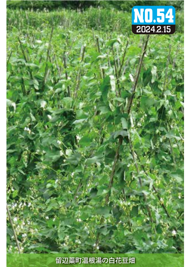
留辺蘂町温根湯の白花豆畑